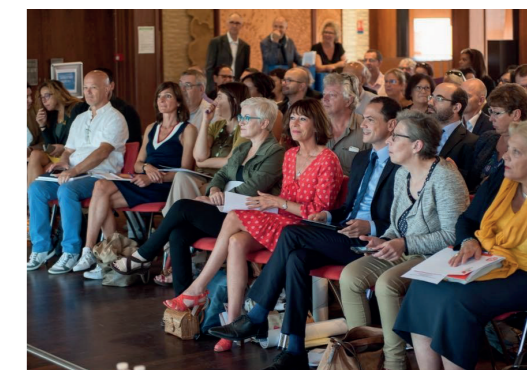
Présentation des actions éducatives du Département aux principaux de collèges – 12 septembre 2018