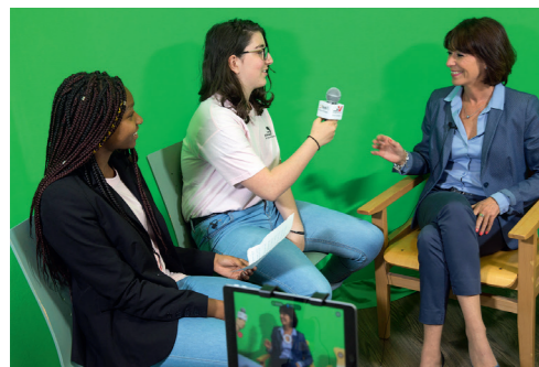
Vobot Challenge à Persan – juin 2018

Attentifs à la réussite de nos collégiens, nous anticipons les besoins induits par la forte poussée démographique de notre Département très attractif. Pas moins de trois nouveaux collèges ont vu ou verront le jour au cours de notre mandat (Herblay en 2017, Cormeilles-en-Parisis en 2019) sans oublier les reconstructions comme à Pontoise en 2017, au Plessis-Bouchard en 2021 et les restructurations à Gonesse, Eaubonne, Ecouen et Mériel.