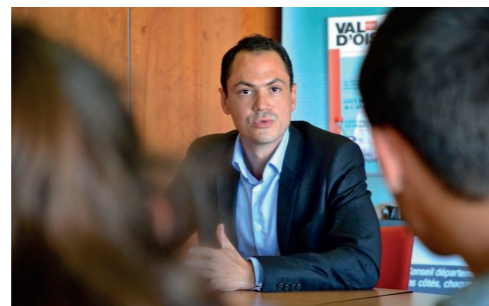
Retour d'expérience ERASMUS + - juin 2018

Le Val d'Oise, territoire de projets Campus International, Europacity, nouvelle Maison Départementale de l'Enfance... Le Conseil départemental s'engage pour rendre nos territoires dynamiques et attractifs.