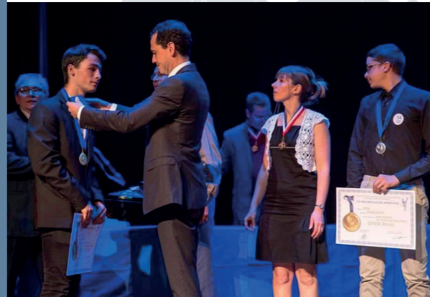
Remise des prix des meilleurs apprentis du Val d'Oise - mai 2018