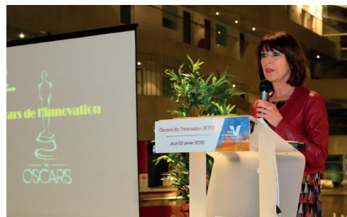
Oscars de l'Innovation – 25 janvier 2018

Aux côtés des plus fragiles Aides aux personnes âgées et handicapées, protection de l'enfance, paiement du RSA... 60% du budget du Conseil départemental est dédié à la solidarité.