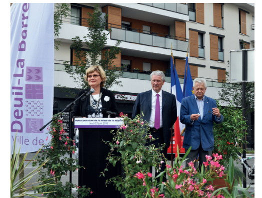
Inauguration de la place de la Nation de Deuil-la-Barre - juin 2016

Nous vous souhaitons une très bonne lecture et renouvelons notre engagement à vos côtés.