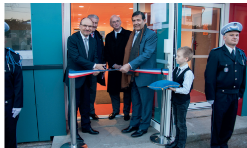
Inauguration de l'Ecole Maternelle des Lévrier - février 2018

« En tant que Vice-Présidente déléguée au Personnel, je travaille très régulièrement avec la Direction des Ressources Humaines (DRH) afin d'assurer le bon fonctionnement des différents services du Conseil départemental, en lien avec les usagers. Cette mission, certes interne, est cependant essentielle car elle garantit aux Valdoisiens un service de qualité à la hauteur de leurs besoins dans un constant souci d'efficacité. »