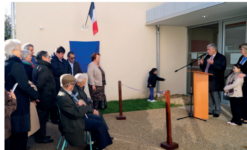
Inauguration de l'extension du restaurant du groupe scolaire Henri Hatrel - 21 novembre 2015

Le Département, premier partenaire des communes Rénovation d'écoles, vidéo surveillance, création de logements... Le dispositif d'aides aux communes du Département, ce sont 110 millions d'euros investis en Val d'Oise.