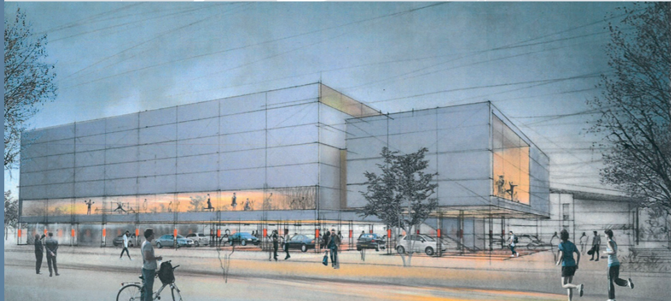
Complexe Alain Mimoun étendu