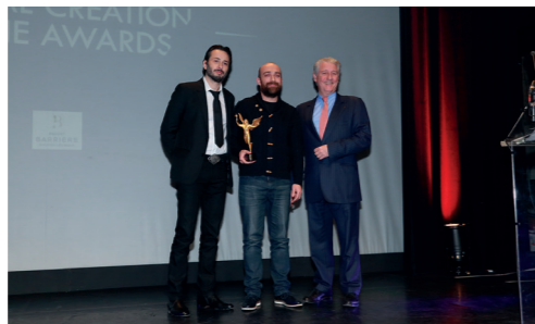
Paris Images Digital Summit à Enghien-les-Bains - janvier 2017

« Le Val d'Oise bénéficie d'atouts de poids qui méritent d'être valorisés pour en faire un acteur incontournable sur le plan économique. Un partenariat de 30 ans s'est notamment noué avec le Japon dans de nombreux domaines (coopération universitaire, implantation d'entreprises...). L'agence économique du Val d'Oise (CEEVO) est un acteur-clé pour renforcer l'attractivité de notre territoire en recherchant en permanence la valorisation des talents et la diffusion des bonnes pratiques en termes d'innovation et de qualité. »