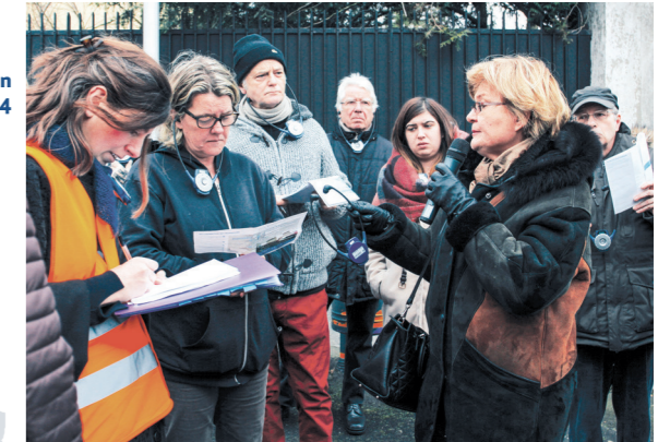
Consultation citoyenne PN4

392 669 € Contrat départemental : rénovation de l'école des Lévriers