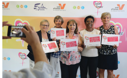
95 femmes se mobilisent contre les maladies cardiovasculaires

Offrir à nos collégiens toutes les chances de réussir Construction et rénovation de collèges, actions éducatives, équipements numériques... Le Département investit tous les ans près de 70 millions d'euros pour la réussite de nos 60 000 collégiens.