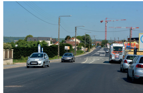
RD106 – Réalisation de la RD106, Avenue de la Libération à Herblay

« Les transports jouent un rôle déterminant dans l'attractivité d'un territoire. En tant qu'administrateur d'Île-de-France Mobilités pour le Val d'Oise, je veille à ce que les préoccupations des usagers valdoisiens soient relayées au plus haut niveau. Je suis également avec une grande attention les projets d'infrastructures en cours nécessaires pour notre département ».