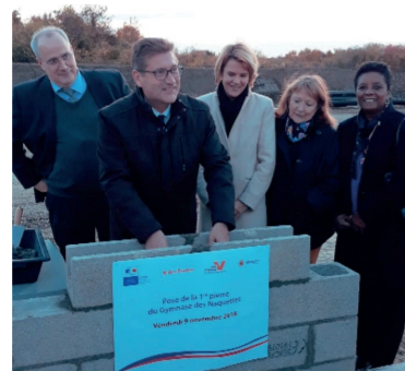
Pose première pierre du gymnase des Naquettes

Le Département, premier partenaire des communes Rénovation d'écoles, vidéo surveillance, création de logements... Le dispositif d'aides aux communes du Département, ce sont 110 millions d'euros investis en Val d'Oise.