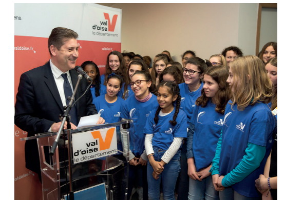
Inauguration du collège Isabelle Autissier, à Herblay