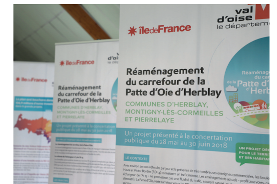
Réunion de concertation avec les habitants