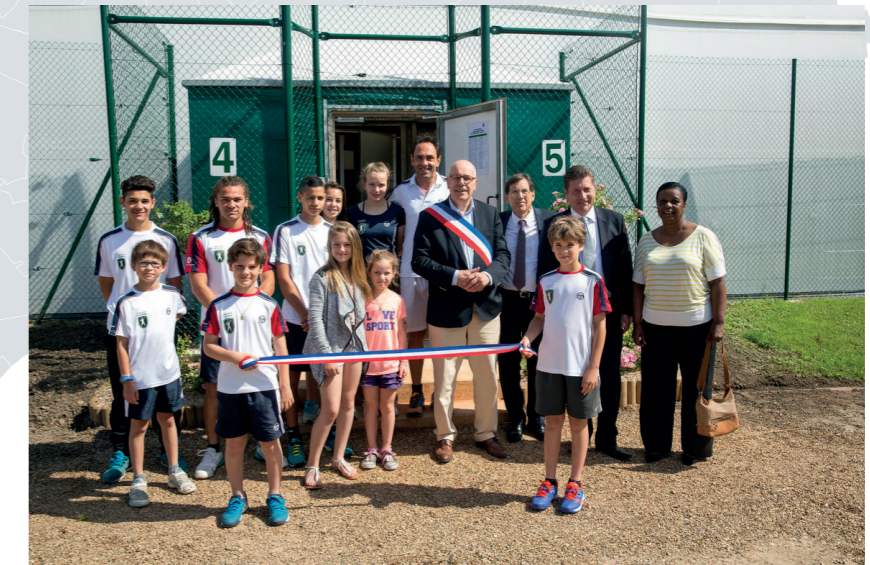
Inauguration de la bulle de tennis de La Frette-sur-Seine, en présence du Maire Maurice Chevigny

La commune de Montigny-lès-Cormeilles entreprend la construction d'un nouveau groupe scolaire de 14 classes et d'un gymnase à proximité de la ZAC de la Gare pour une livraison fin 2019. Le Conseil départemental, partenaire privilégié des communes, finance ce projet à hauteur de 1 420 000 €.