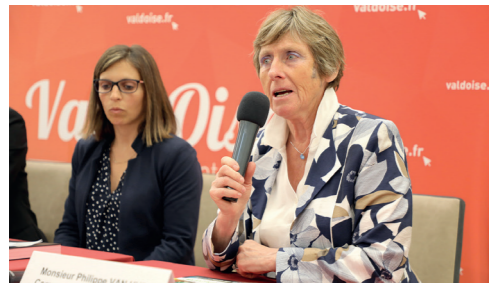
Signature de la charte du développement durable - mai 2018