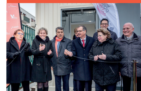
Inauguration de l'armoire de rue de Beaumont-sur-Oise et Persan - décembre 2017

Le Département du Val d'Oise est très investi sur le déploiement du numérique et de la fibre optique. Comme nous nous y étions engagés, l'ensemble du territoire sera couvert à horizon 2020. Les collèges ont été tout particulièrement suivis. Afin de permettre à nos élèves de bénéficier de technologies innovantes, notre collectivité a répondu ces deux dernières années à un appel à projets du Ministère de l'Éducation Nationale « Collèges numériques et innovation pédagogique ». Deux établissements par Département sont labellisés en fonction de leurs projets. En 2016, le collège Georges Brassens de Persan, précurseur en la matière, figurait parmi ceux-là.