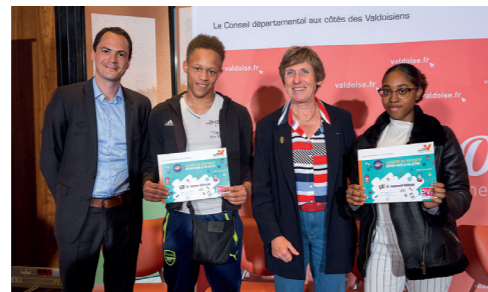
Remise des attestations EVA - 14 mai 2018

Offrir à nos collégiens toutes les chances de réussir Construction et rénovation de collèges, actions éducatives, équipements numériques... Le Département investit tous les ans près de 70 millions d'euros pour la réussite de nos 60 000 collégiens.