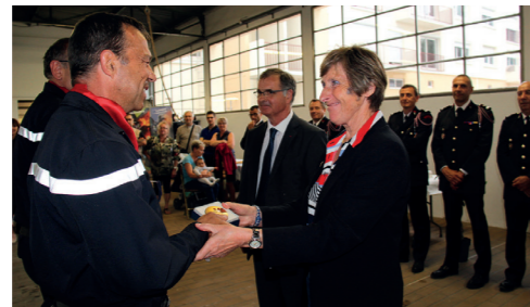
Remise de galons au centre de secours de l'Isle-Adam - 25 mai 2018