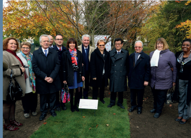
Accueil du Gouverneur d'Osaka au château d'Auvers-sur-Oise, en présence de nombreux élus départementaux – 17 novembre 2017