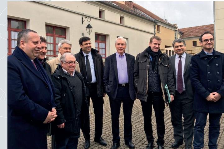
Réunion sur la Plaine de Pierrelaye, en présence de nombreux élus municipaux, départementaux et régionaux – février 2018

Le Département est particulièrement impliqué dans le projet d'aménagement de la plaine de Pierrelaye-Bessancourt. Celui-ci prévoit la plantation d'un million d'arbres, créant ainsi un véritable poumon vert au cœur de notre territoire qui mêle la ruralité et les zones fortement urbanisées. Le projet global de long terme, financé par la Région, le Département et les communes concernées, est estimé à plus de 84 millions d'Euros. Conscients de la nécessité d'apporter aux futures générations un cadre de vie agréable, nous nous projetons vers l'avenir avec ambition et dans le respect des ressources dont nous disposons.