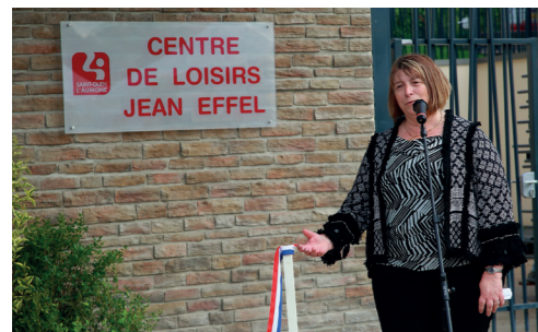
Inauguration du centre de loisirs Jean Effel de Saint-Ouen-l'Aumône – juin 2016

Le Département, premier partenaire des communes Rénovation d'écoles, vidéo surveillance, création de logements... Le dispositif d'aides aux communes du Département, ce sont 110 millions d'euros investis en Val d'Oise.