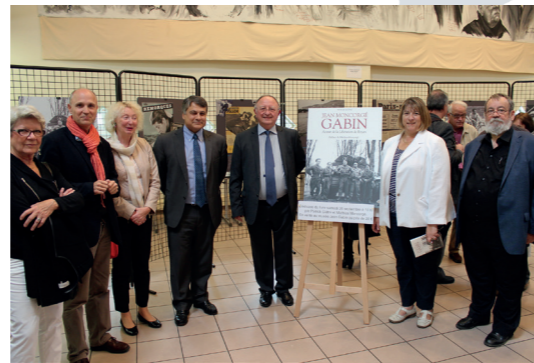
Exposition sur Jean Gabin à Mériel (2015)

Entretien des équipements culturels/Subvention festivals 720 000 € (Auvers-sur-Oise)