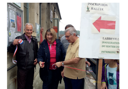
Inauguration du sentier du patrimoine de Labbeville – 30/06/2016