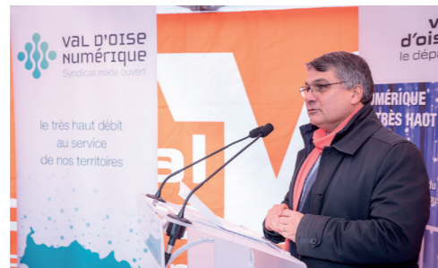
Inauguration d'une armoire de rue à Beaumont et Persan – décembre 2017

Bénéficier d'une connexion à très haut débit, pour développer l'attractivité du territoire et lutter contre la fracture numérique est désormais une nécessité. Le Département s'est engagé à raccorder 100 % de son territoire à la fibre, jusqu'aux fermes les plus isolées du Vexin, d'ici 2020. Cet engagement, qui concerne 84 000 logements et représente 100 millions d'euros d'investissement et 1 500 kilomètres de réseau fibre à déployer, sera tenu !