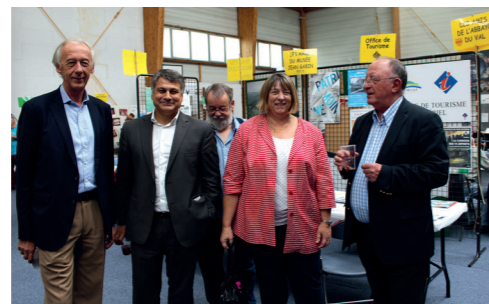
Forum des associations de Mériel en présence d'Axel Poniatowski, ancien Député du Val d'Oise – septembre 2015

Aux côtés des plus fragiles Aides aux personnes âgées et handicapées, protection de l'enfance, paiement du RSA... 60% du budget du Conseil départemental est dédié à la solidarité.