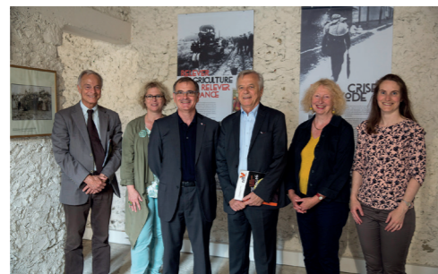
Exposition « Partie de campagne » La Roche Guyon avec Arnaud Bazin, ancien Président du Conseil départemental (juin 2018)

La culture : pour tous, avec tous et par tous ! Tel est notre mot d'ordre afin de soutenir et préserver les joyaux du Val d'Oise : le Château d'Auvers-sur-Oise, celui de la Roche Guyon, ou encore l'Abbaye de Royaumont qui accueille chaque année des manifestations prestigieuses que le Département est fier d'accompagner.