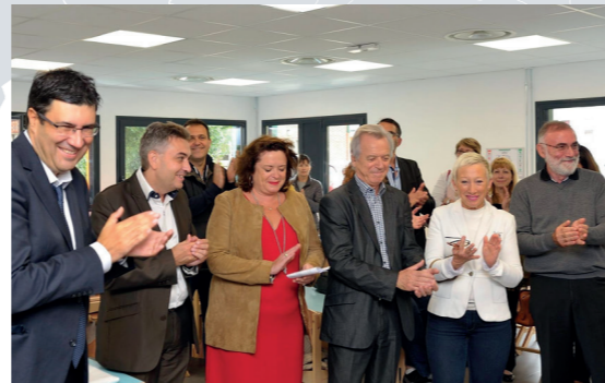
Restaurant scolaire Antoine de Saint Exupéry

Notre territoire est divers et renferme des atouts naturels qu'il faut protéger. Le projet d'aménagement de la plaine de Pierrelaye-Bessancourt prévoit la plantation d'un million d'arbres, créant ainsi un véritable poumon vert au cœur de notre territoire mêlant à la fois la ruralité et les zones fortement urbanisées. Conscients de la nécessité d'apporter aux futures générations un cadre de vie agréable, nous nous projetons vers l'avenir avec ambition et dans le respect des ressources dont nous disposons.