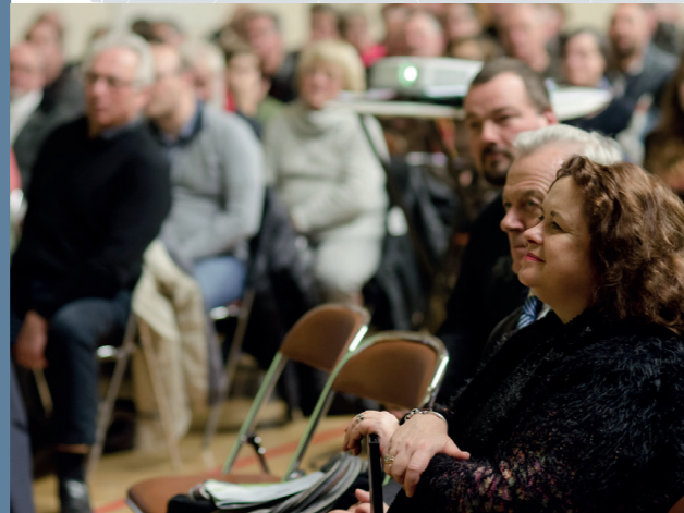
Réunion publique sur la plaine de Pierrelaye-Bessancourt (janv. 2018)