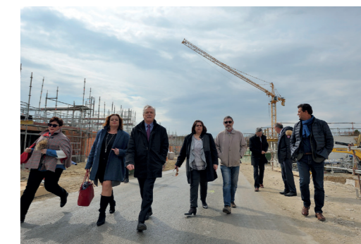
1 ère pierre école Louise Michel de Pierrelaye