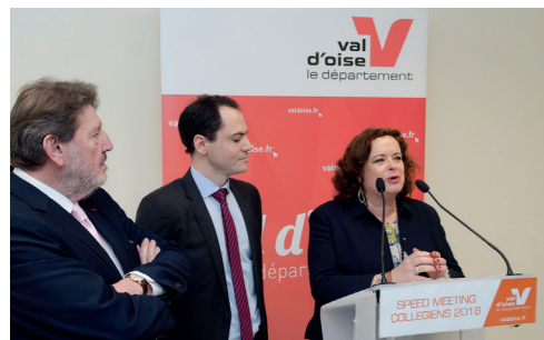
Speed-meeting de Taverny en présence d'Armand Payet, Conseiller départemental (janvier 2018)

Le soutien aux aînés est une priorité du Département. Les maintenir le plus longtemps possible à domicile est essentiel. Luttant contre la solitude des personnes âgées, nous avons signé la charte MONALISA (« MOBilisation NATIONALE contre L'ISolement des Agés »). Nous sommes fiers d'accompagner les Valdoisiens à toutes les étapes de leur vie.